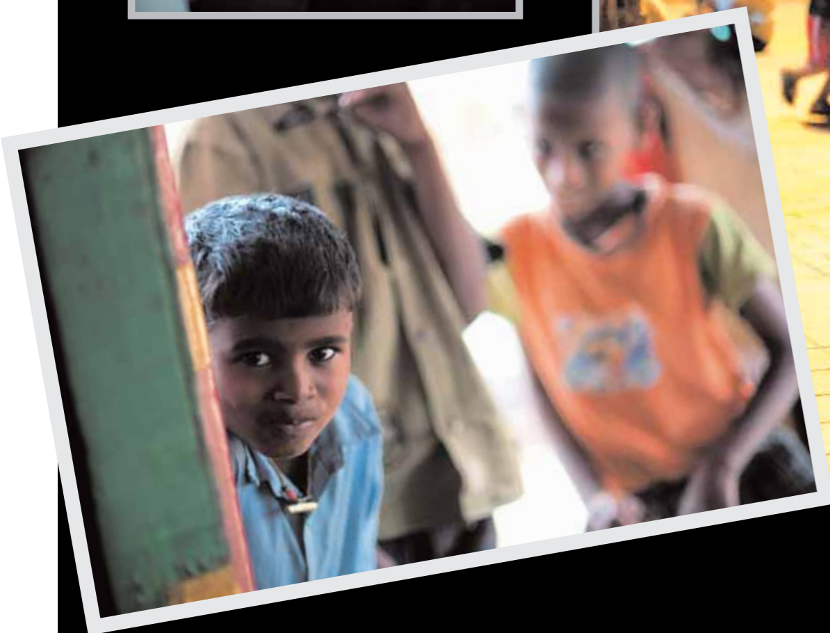
IN ALTO UN'IMMAGINE DI VITA QUOTIDIANA DI KASHGER, IN CINA A SINISTRA RITRATTO DI UN ANZIANO IN KIRGISTAN E SOTTO UN BAMBINO DEL VILLAGGIO A PUNE, IN INDIA